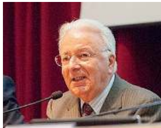
Inventore. Faggin ieri in Cattolica

L'inventore del microchip a Brescia per parlare di scienza e di filosofia