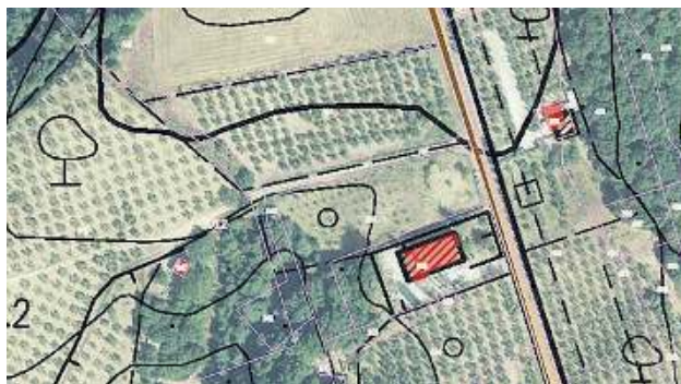
La mappa. In rosso alcuni edifici che non risultano censiti al catasto

BEDIZZOLE. E tre. In solo due mesi. Tanti sono stati gli incendi alla Faeco di Bedizzole. Sindaco preoccupato. A PAGINA 18